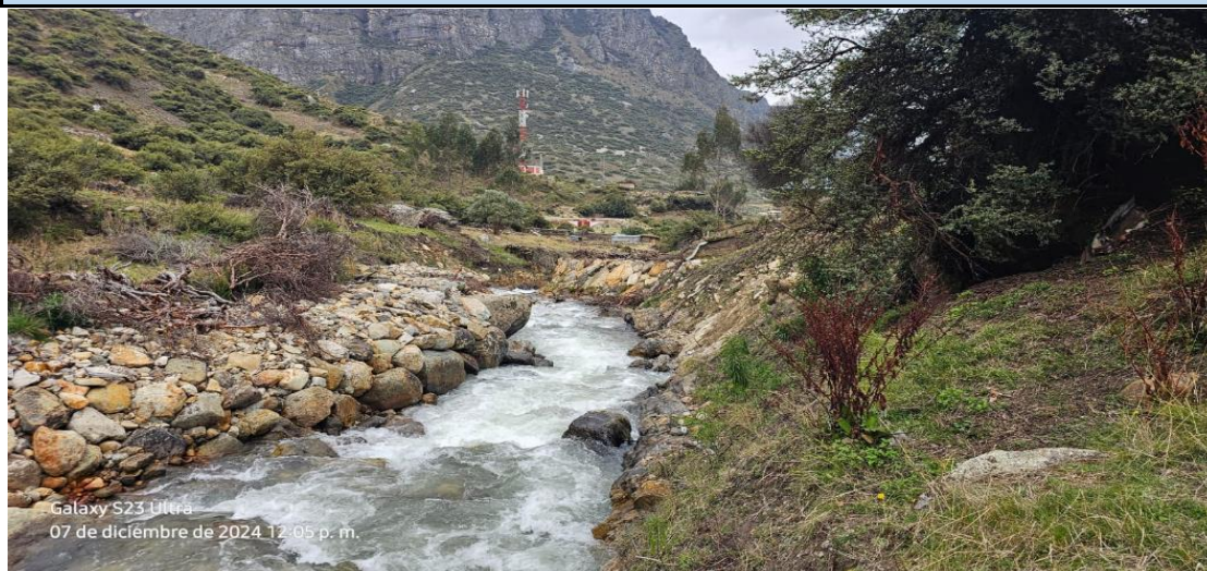
FOTOGRAFIA 01: Vista en la que se aprecia el cauce de la quebrada, la cual se encuentra colmatada, producto de las máximas avenidas.