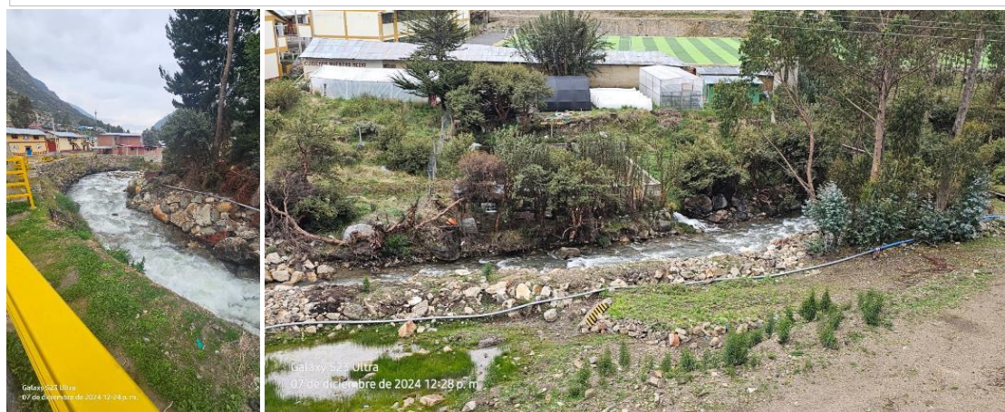
FOTOGRAFIA 02: Vista en la que se aprecia la carencia de diques secos con acumulacion de material propio en ambas margenes del RIO QUICHAS.